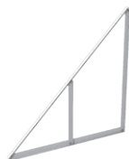
Art. TK-003 Trójkąt sztuk: 3