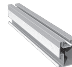
Art. 0109 Szyna montażowa Długość: 3300mm sztuk: 2